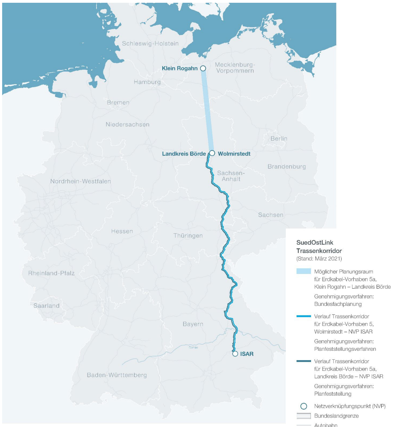
Abbildung 1: Trassenkorridore SuedOstLink

Die Zulässigkeit einer planungsrechtlichen Abschnittsbildung ist in der Rechtsprechung des Bundesverwaltungsgerichts grundsätzlich anerkannt. Ihr liegt die Erwägung zugrunde, dass angesichts vielfältiger Schwierigkeiten, die mit einer detaillierten Streckenplanung verbunden sind, die Planfeststellungsbehörde ein planerisches Gesamtkonzept häufig nur in Teilabschnitten verwirklichen kann. Dritte haben deshalb grundsätzlich kein Recht darauf, dass über die Zulassung eines Vorhabens insgesamt, vollständig und abschließend in einem einzigen Bescheid entschieden wird. Jedoch kann eine Abschnittsbildung Dritte in ihren Rechten verletzen, wenn sie deren durch Art. 19 Abs. 4 Satz 1 GG gewährleisteten Rechtsschutz faktisch unmöglich macht oder dazu führt, dass die abschnittsweise Planfeststellung dem Grundsatz umfassender Problembewältigung nicht gerecht werden kann, oder wenn ein